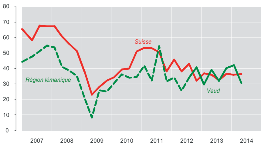
Situation des affaires